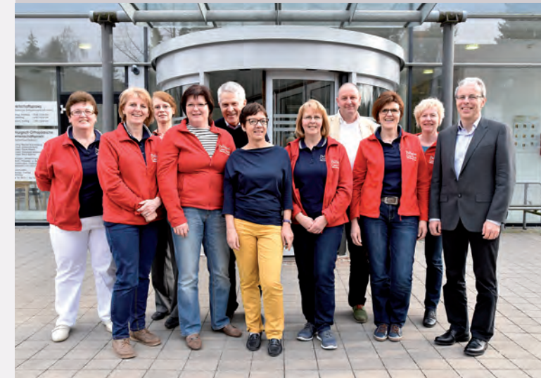
Palliative Care-Team Nürnberger Land